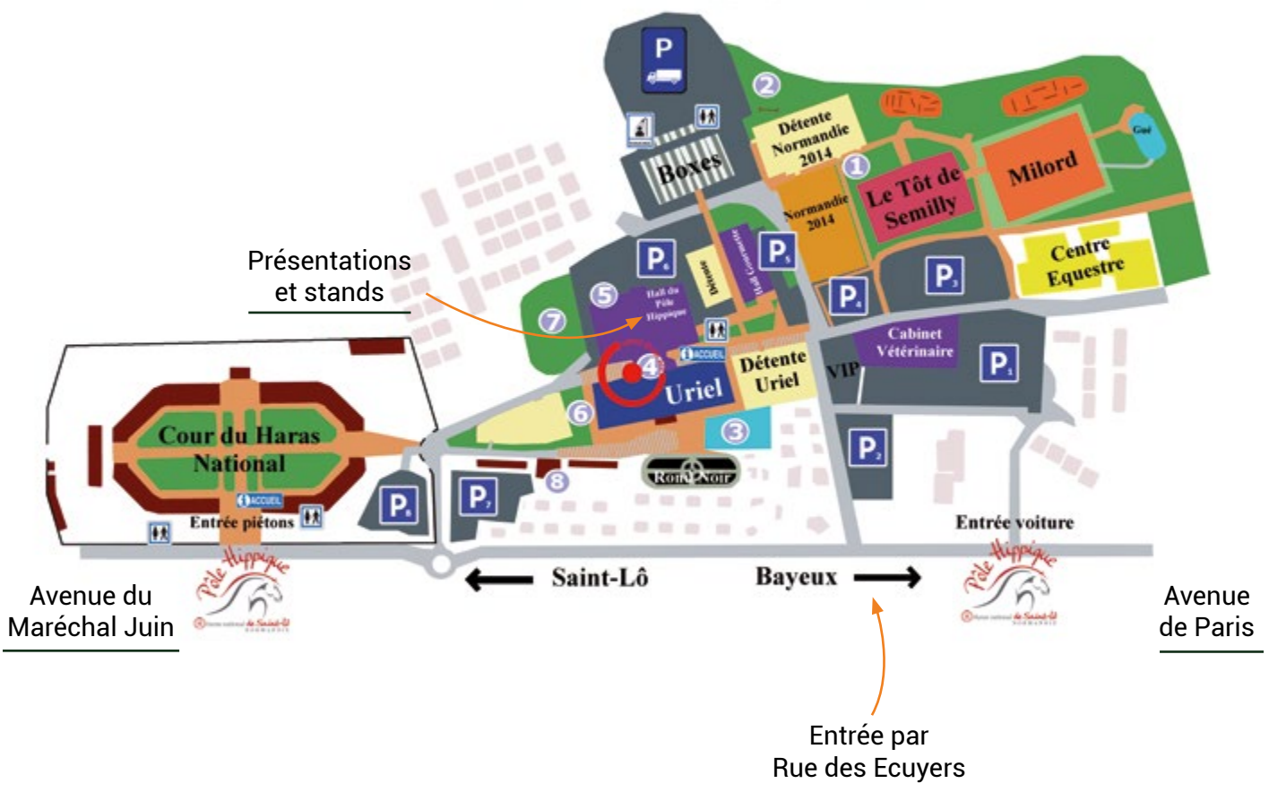
Plan du Pôle Hippique de Saint-Lô