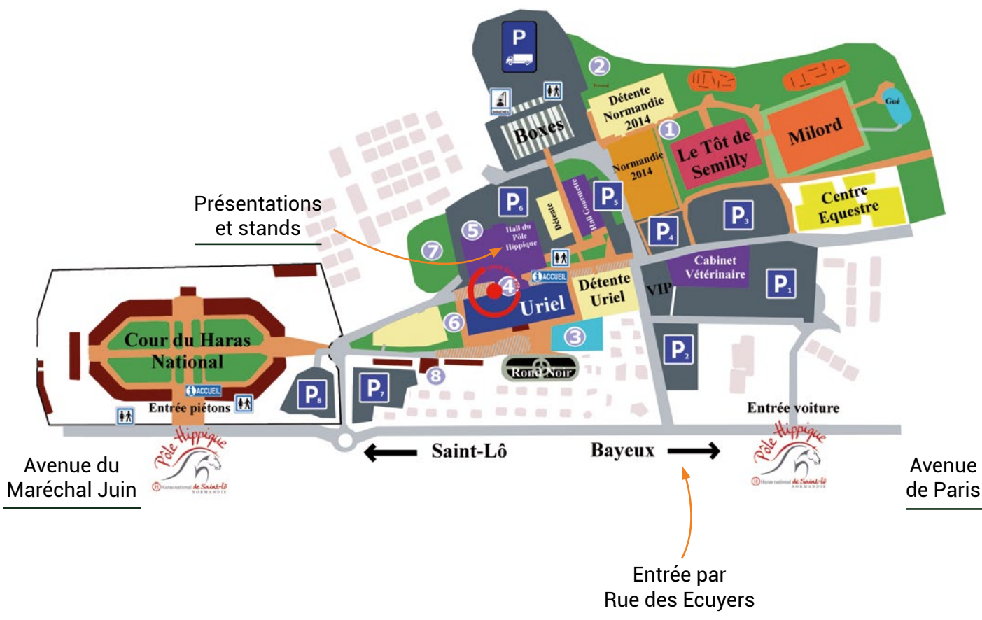
Plan du Pôle Hippique de Saint-Lô