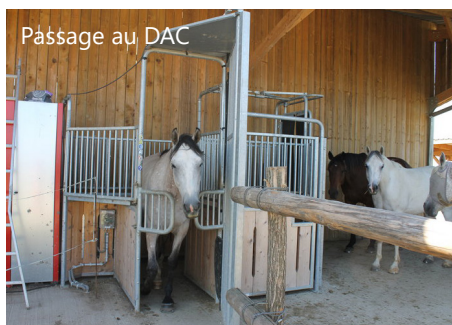
Passage au DAC

2 lots de tailles identiques sont gérés sur la structure. Chaque lot dispose d'un distributeur automatique de concentrés, d'une aire de couchage paillée, d'une aire de couchage sur tapis et de râteliers à fourrages équipés de filets. Pour chaque lot s'applique le principe de la marche en avant avec un cheminement obligatoire pour se rendre d'un point d'intérêt à un autre.