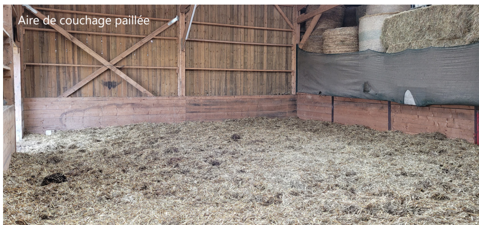
Aire de couchage paillée

2 lots de tailles identiques sont gérés sur la structure. Chaque lot dispose d'un distributeur automatique de concentrés, d'une aire de couchage paillée, d'une aire de couchage sur tapis et de râteliers à fourrages équipés de filets. Pour chaque lot s'applique le principe de la marche en avant avec un cheminement obligatoire pour se rendre d'un point d'intérêt à un autre.